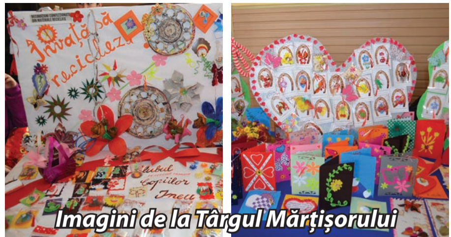
Imagini de la Târgul Mărțișorului