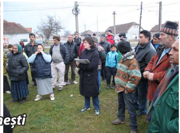
Imagini de la adunările cetățenești