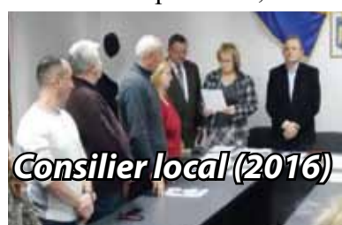
Consilier local (2016)