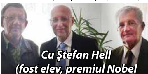
Cu Ștefan Hell (fost elev, premiul Nobel)