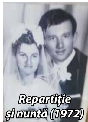
Repartiție și nuntă (1972)

Din anul 2001 și încă pentru următorii patru ani, am benefici-