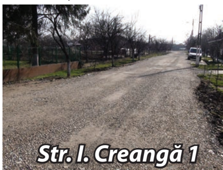
Str. I. Creangă 1

s-au putut curăța bine de pământ și la primele ploii s-au umplut de noroi. Nici iarna nu a ținut cu noi, ca să ningă, să înghețe și în felul acesta să nu ne mai murdărim. Pe unele străzi nu s-a putut introduce canalizarea pentru că în proiectul inițial nu a fost prevăzut acest lucru. Fiind un proiect cu finanțare europeană, acesta nu poate fi schimbat. Canalizarea pe străzile omise urmează să fie făcute într-o etapă ulterioară. Pe parcursul desfășurării lucrărilor ne-am lovit și de alte probleme de proiectare, însă la final proiectantul a găsit rezolvarea. Să spunem că a fost un rău necesar, însă care într-un final ne va aduce mulțumire.