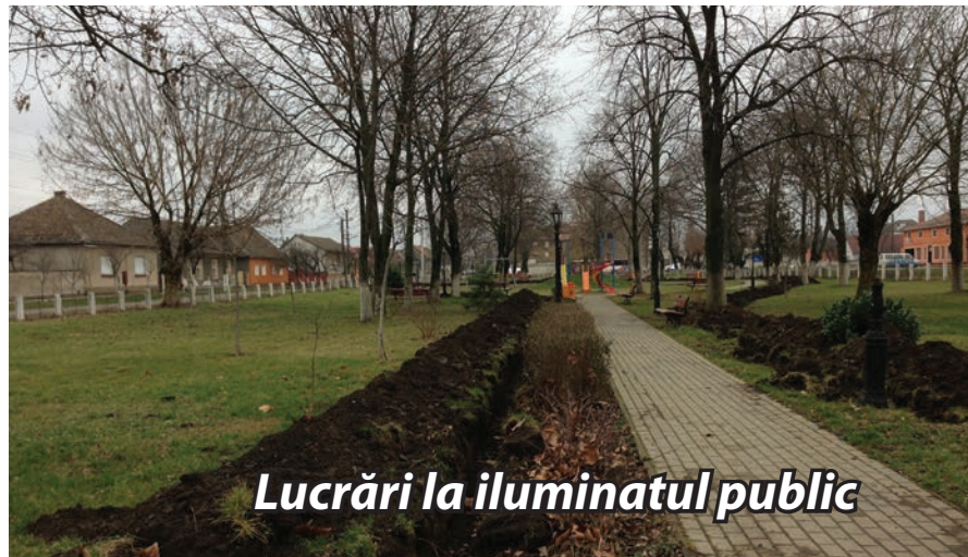
Lucrări la iluminatul public

Se lucrează la refacerea sistemului de iluminat din cele două parcuri de pe strada Mihai Viteazul. Acest lucru este necesar deoarece la scurt timp după darea în folosință, în anul 2008, cablul de alimentare al felinarelor din parc a fost tăiat în urma lucrărilor de întreținere a spațiului verde.