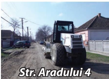
Str. Aradului 4

Lucrările de introducere a canalizării sunt în grafic din punct de vedere al stadiului de execuție și al raportării în timp. La sfârșitul anului 2015, după ce se va finaliza și proiectul de construcție a stației de epurare, aproape 2000 de gospodării vor fi racordate la rețeaua de canalizare. În termen de două luni vor fi refăcute și drumurile ce au fost deteriorate ca urmare a săpăturilor executate pentru canalizare.