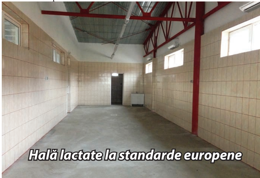
Hală lactate la standarde europene

A fost făcută recepția lucrărilor de la noua hală de lactate din piața agro-alimentară. Urmează ca în cel mai scurt timp să fie dată în folosință, asigurându-se astfel condiții moderne pentru desfacerea și comercializarea produselor lactate.