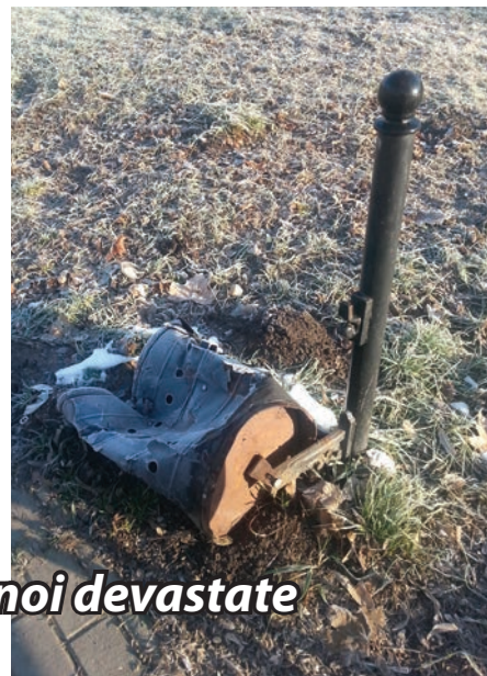
Coșuri de gunoi devastate