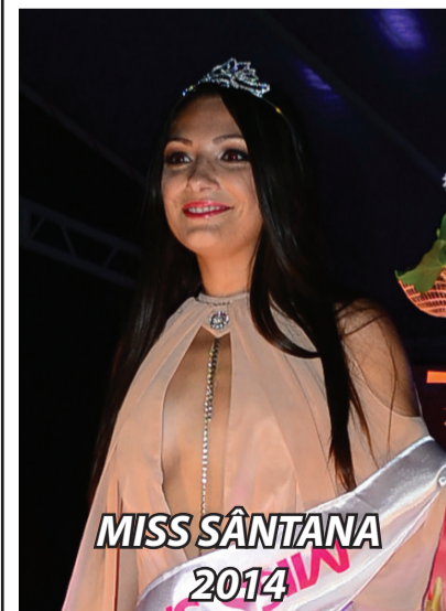
MISS SÂNTANA 2014